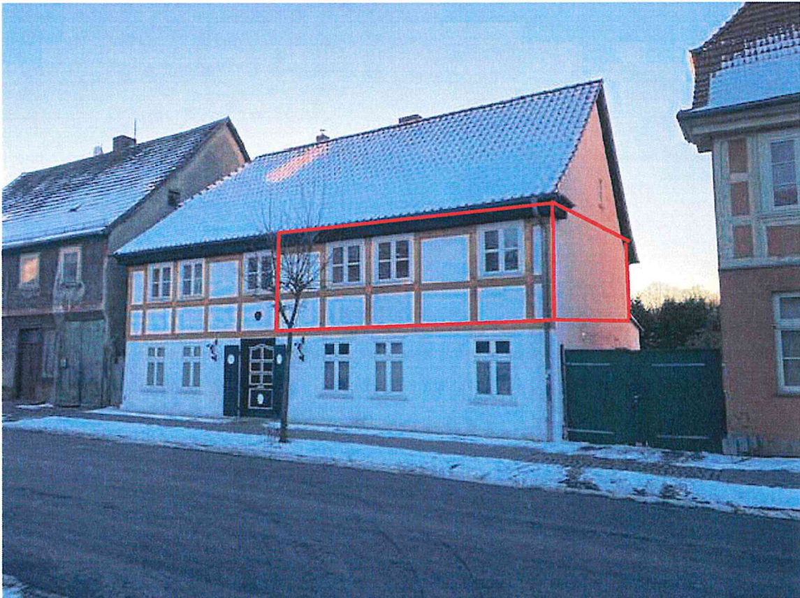
Straßenansicht mit nördl. Bereich des Obergeschosses für die gewünschte Umnutzung.